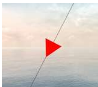
Судно, осуществляющее перевозку опасных грузов.