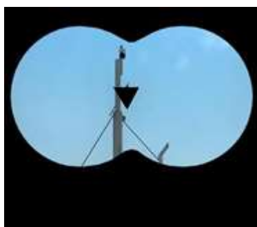
Судно, идущее под парусом и одновременно использующее силовую установку.