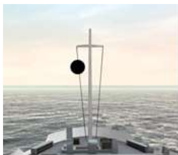
Судно, стоящее на якоре.